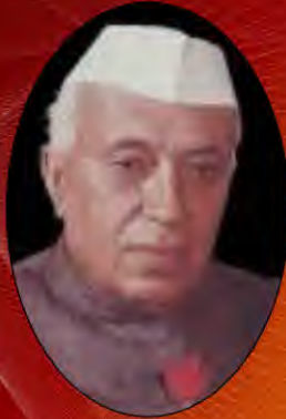
Jawaharlal Nehru ,